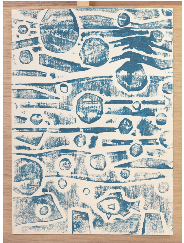
↑こちらが出来上がった紙版画