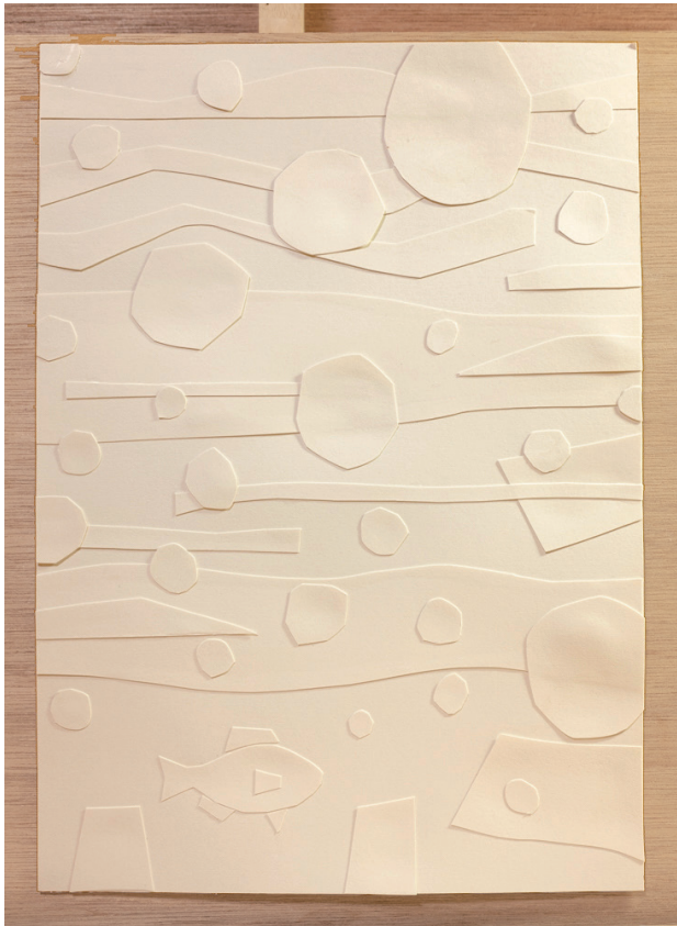
↑こちらが紙版画の版

「版画」は、木や石などでできた「版」にインクをつけて、それを紙に写してできる絵の事です。 版画の特徴はひとつの版で同じ絵を何枚もつくれるところです。版の材料によって名前が変わり、木を彫って版をつくるのが「木版画」、平らな石で版をつくるのが「石版画」です。今回つくる「紙版画」は紙でつくる版画の事です。紙版画の版は下の写真のように紙を貼りつけてつくります。